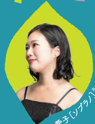
櫻井愛子 [ソプラノ]*